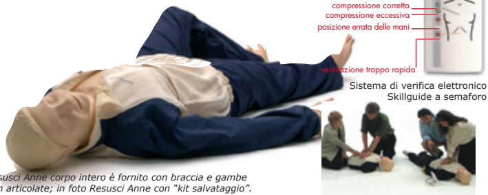
Resusci Anne corpo intero è fornito con braccia e gambe non articolate; in foto Resusci Anne con "kit salvataggio".

Solo torso con skillguide + borsa rigida: Codice AP1451 Prezzo: euro 1690 Peso kg 16