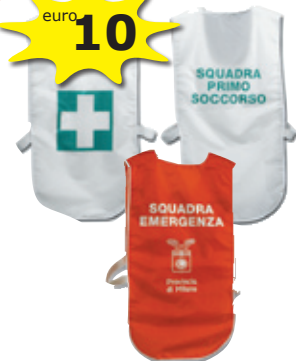
esempio di gilet personalizzato